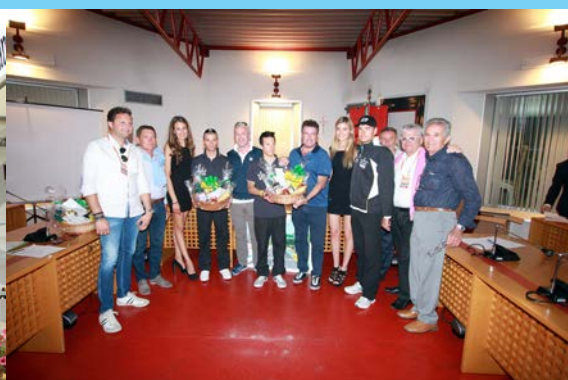
alcuni momenti della gara e della premiazione